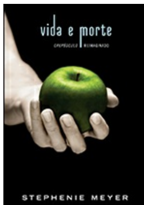
Vida e morte